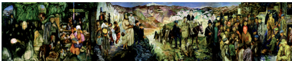
Lucania '61 di Carlo Levi. Matera, Museo Nazionale Palazzo Lanfranchi