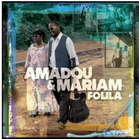
Amadou & Mariam

Amadou & Mariam, entrambi non vedenti e non più giovanissimi, sono una coppia di musicisti africani che ha calcato per decenni solo i palchi dell'Africa occidentale. Poi, grazie ad un album del 2005, "Dimanche à Bamako", la loro musica ha messo il turbo ed è esplosa in tutto il mondo. A Matera, data unica in Italia per il 2015, saranno presenti con una straordinaria band di 10 elementi.